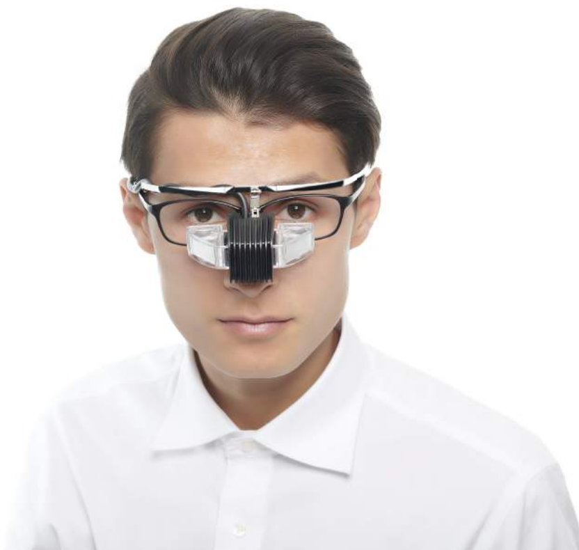
【「b.g.着用イメージ」メガネの上からも着用可能】